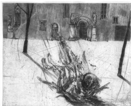
Ein Sohn Davids

Oskar Maria Graf ist einer der Schriftsteller, deren Werk viele Illustratoren gereizt hat und immer noch reizt.