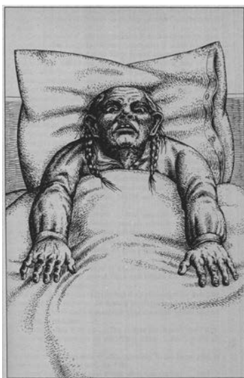
Hans Ticha, Illustration zu Es stirbt wer In: Raskolnikov auf dem Lande

Ausführlich befasst sich Ulrich Dittmann mit dem Unterschied und der literarischen Bewertung der beiden Erzählungen von L. Thoma und O. M. Graf im Jahrbuch 1993 der Oskar-Maria-Graf-Gesellschaft; er hat damit eine seither oft zitierte, prägnante Grundlage geschaffen, die Literatur und die Persönlichkeit der beiden bayrischen Autoren zu verstehen.