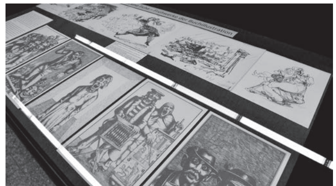
Illustrationen von Josef Hegenbarth zu

Derartige Autorenbilder können dem Lesepublikum durch vielfältige Reproduktion – und Grafts spektakuläre Auftritte boten immer wieder Anlässe zu neuen Bildern – selbst dem geneigtesten Leser der Zugang zu den Werken erschweren; vorausgesetzt die Leser hatten Zugriff auf die Werke gehabt. Der war aber für Grafts Werke keineswegs selbstverständlich. Seine Vorkriegsveröffentlichungen gingen in den Flammen auf, die ihm die Münchner Studenten nach dem Appell vom 12. Mai zugesichert hatten; es gab ja nicht nur die eine Bücherverbrennung! Von den Exilwerken fielen nach dem Kriege die meisten der allgemeinen Stimmung gegen die angeblich im Exil schwelgenden Schriftsteller zum Opfer. Dazu kam die zunehmende Entfremdung der beiden Deutschland, wer hier gedruckt wurde, fiel dort in Ungnade und vice versa. Dass sich viele Exilanten zunächst der DDR. als dem ‚besseren Deutschland‘ zuwandten, machte sie im Westen verdächtig. Dass Graf auch im Westen drucken ließ, brachte ihm im Osten zeitweise