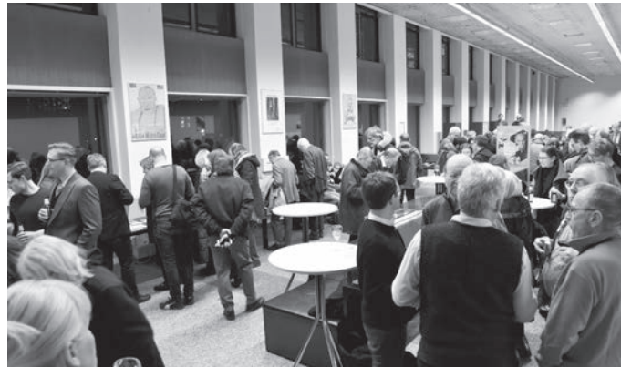
Angeregt diskutierende Ausstellungsbesucher

im Duodez-Taschenbuchformat gegenüber. Erst deren zweite Auflage brachte die ganze Sammlung. Aber ausgerechnet sie blieben, im Gegen-