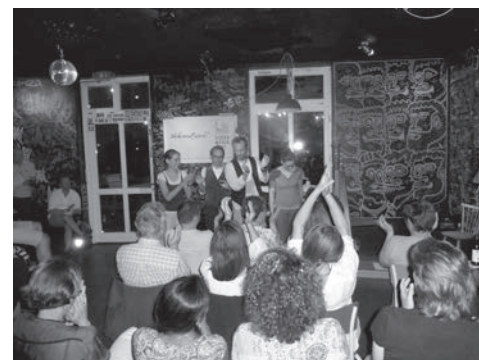
und am Schluss der wohlverdiente Beifall